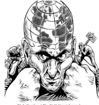
Globalization / The Wall Street Journal

في عصر العولمة ، و جب أن يوازي التقدم العلمي السمو الأخلاقي، و إلا فستقلب النعمة إلى النقمة . و صدق أمير الشعراء أحمد شوقي حين قال: « و إنما الأمم الأخلاق ما بقيت، فإن همو ذهبت أخلاقهم ذهبوا