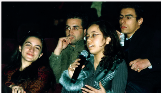
إقبال الطلبة على الأفلام ومساءلة قضايا السينما المغربية

السينمائي و الفرق بين الفيلم القصير والطويل. وغيرها من الأسئلة المباشرة التي تم مناقشتها من مختلف الزوايا. إلا أن أكثر المواضيع حساسية كان موضوع فيلم "البحر" الذي تفاعل معه السيد رئيس جامعة الأخوين بحماس وانفعال منقطعي النظر. حيث أبى إلا أن يقف ويستدير موجها خطابه لكل الحاضرين حول حساسية المشكلة وأضاف إلى علمهم جسامة المعضلة. حيث شد بحرارة على يد المخرجة لاختيارها تناول موضوع ماثل.