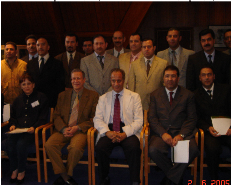
موظفو وزارة الداخلية المستفيدون من الدورة التكوينية في صورة مع السيد الرئيس

هذه الدورة التكوينية هي الخامسة لسنة 2006 كما سبقتها دورات سابقة هل كان لهذه الدورات أثر في التغيير وهل لامست وجود أثر لهذه الدورات على هؤلاء الأطر وهل هناك