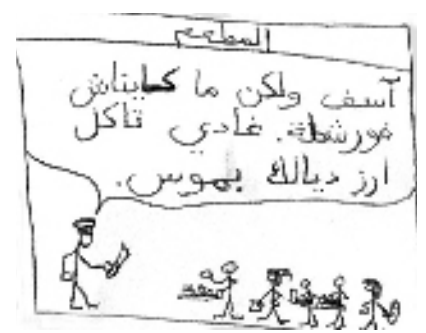
رسم كاريكاتوري لرافي كنيريا

هو مطروح دائما. وهذا يرجع بالأساس لكون المطعم غير مؤهل لاستقبال أعداد كبيرة في وقت واحد. إذ يكفي أن يصطف بضع عشرات من الطلبة حتى يصبح مزدحما. وأظن أن هذه الظاهرة لا تقتصر على مطعمنا. إذ أنه من الضروري الانتظار في أي مطعم مدة معينة قبل استلام الطلب. الحل البديل الذي نعمل على إيجازه هو الكلوب هاوس. وهو بناية بجانب ملعب التنس ستضم مطعما للأكلات الخفيفة. لن يكون هذا بطبيعة الحال حلا جذريا. لكنه سيخفف من حدة المشكل. لا يمكن إنكار أن أعداد الطلبة الجدد تزداد كل دورة بمقابل الطلبة المتخرجين. إلا أن الانتظار أحيانا يكون راجعا لأسباب تقنية كنقص التجهيزات (الشوكات، الملاعق...) أو لقلة المستخدمين. وهو ما نحاول التعامل معه من خلال تشغيل موظفين إضافيين كلما دعت الحاجة الى ذلك. بالنسبة لمشكل نقص الدائم في الشوكات والملاعق فأنا مقتنع بأن الجزء الأكبر من المسؤولية تقع على الطلبة. طبعاً هناك احتمالات التلف أو الضياع. لكن الأعداد التي تختفي يوميا كبيرة جدا. خصوصا أننا نعاين حالات كثيرة لأدوات المطعم في غرف الطلبة أو في العلب التي يأخذون فيها الأكلات خارج المطعم. هذه الإختفاءات كلفت الجامعة سنة 2005 مثلا 580 87درهم. للحد من هذا المشكل. ارتأينا البدء في استعمال أدوات عليها شعار الجامعة. وبذلك سيعاقب كل من وجدت