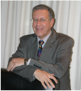
السيد الرئيس متحدثاً عن مرصد المبادرة الوطنية للتنمية البشرية

والتهميش والإقصاء. وهذه فرصة لأساتذتنا وطلبتنا لأجل إثبات قدراتهم في هذا الميدان باعتبار الجامعة خلية للبحث العلمي.