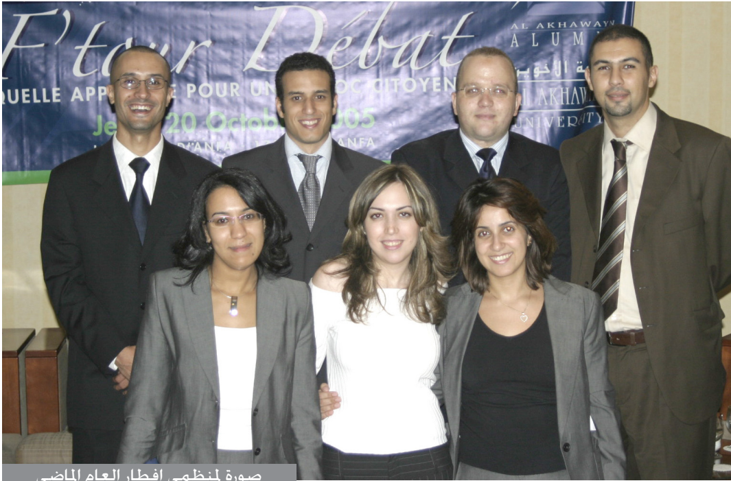
صورة لمنظمي إفطار العام الماضي

* ستنظم جمعية خريجي الجامعة ندوتها الرمضانية يوم الثلاثاء 17 أكتوبر كما هي العادة بفندق أنفا بالدار البيضاء. سيكون موضوع النقاش هذه المرة "الشباب والسياسة: لماذا المشاركة في انتخابات 2007؟" هذا التقليد الذي دأب على تنظيمه بنجاح طلبتنا يحظى بتغطية صحافية مهمة. ويترقب المنظمون مشاركة كل من السيد محمد عيوش -جمعية 2007 دابا- إدريس كسيكس-مجلة نيشان- مولاي حفيظ العلوي -الإخاد العام لمقاوات المغرب- نادبة صلاح -لكونومست- كما سيحضر النقاش أحد وزراء حكومة السيد إدريس جطو.