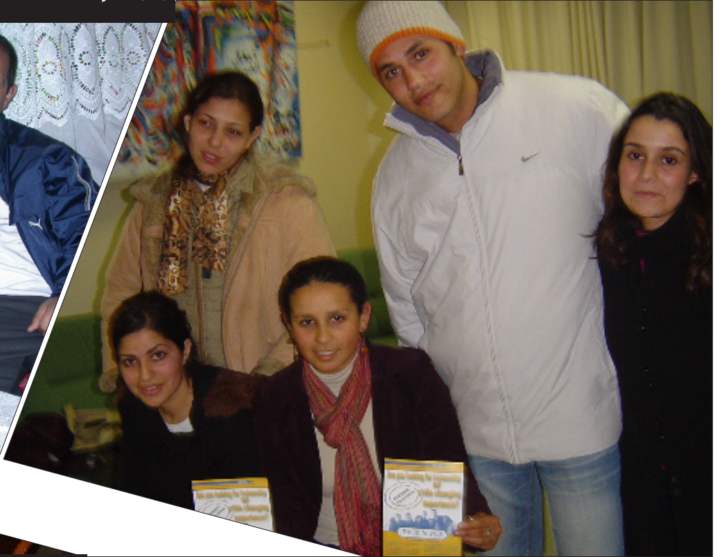
زيارة طلبة من فرنسا للجامعة للتعرف على نادي إراسموس