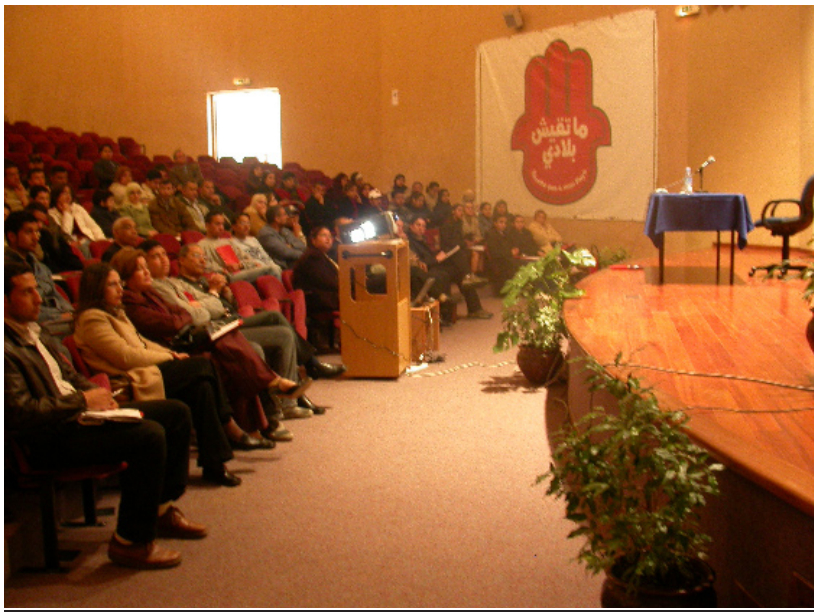
الآباء يشاهدون الفيلم الرسمي للجامعة

من الثانوية الى الجامعة ذلك انها تركز أساسا على تطوير ملكات الفهم والتحليل ودعوة الطالب الى مساءلة قضاياها والكشف عن اهتماماته. الجناح المخصص لكل من مركز اللغات وكلية ادارة الأعمال نجح هو الآخر في سرق الأضواء وجعل كل شاب مقبل على ولوج عالم الدراسات العليا يتمنى لو تكون جامعة الأخوين بشعار الهوية والامتياز وجهته وقبلته بعد اجتياز امتحانات البكالوريا بنجاح.